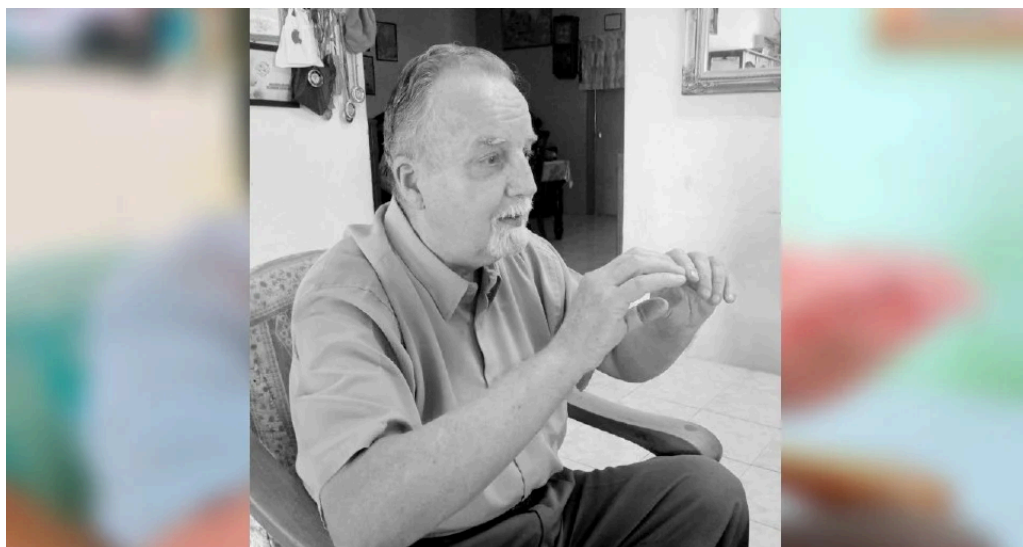
Pelakon 'mat saleh' meninggal dunia