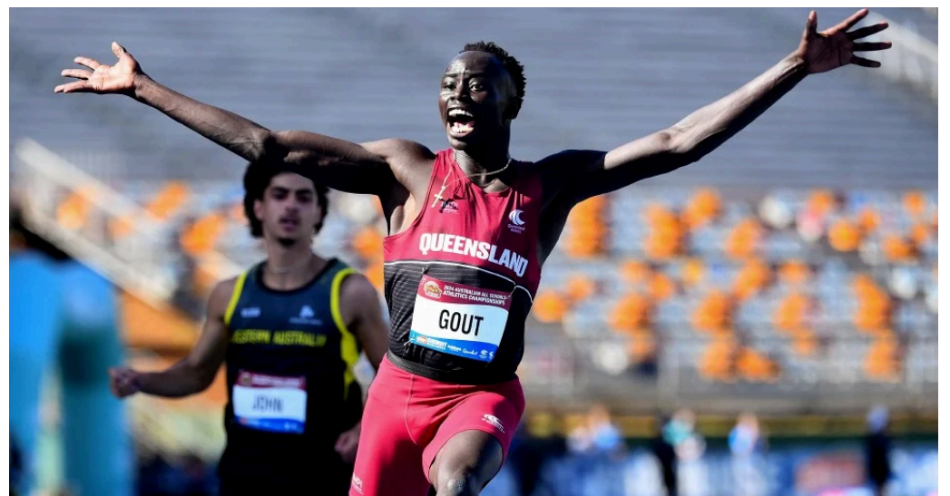
Gout lebih hebat daripada Bolt, pecah rekod berusia 56 tahun