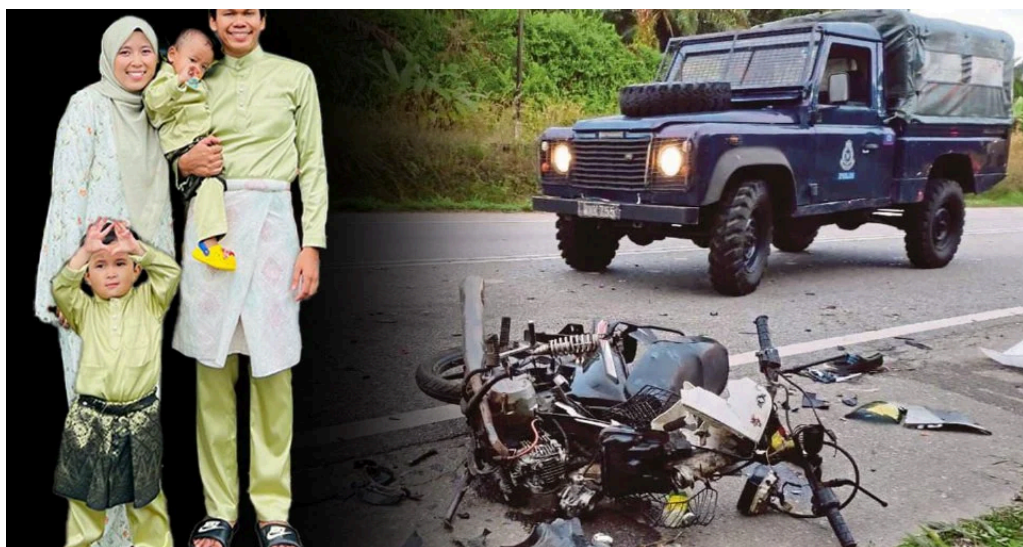
'Hidup kami tak lagi seindah dahulu'