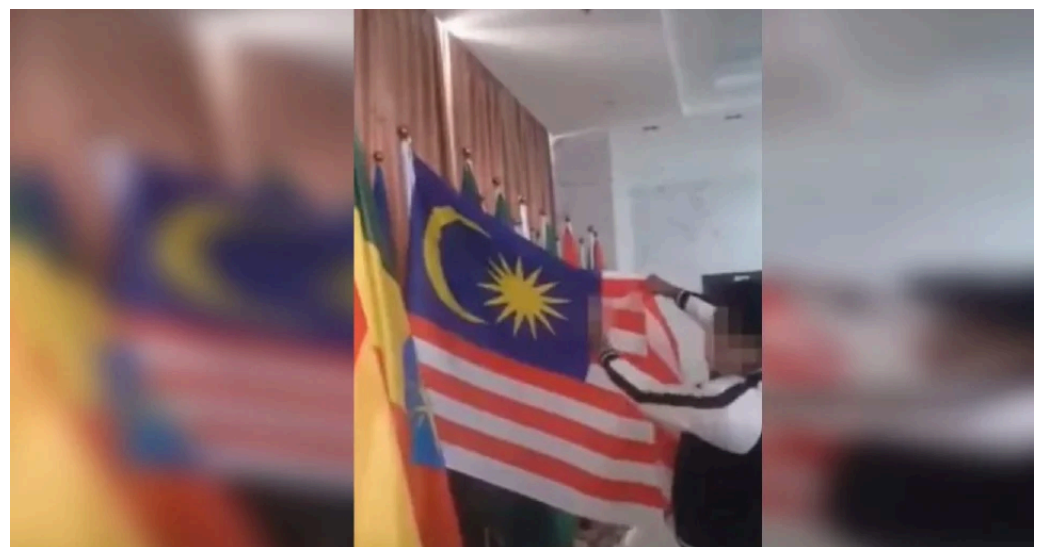
Tindakan warga Bangladesh ludah Jalur Gemilang biadab